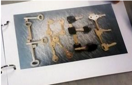
Leuke verrassende associatie