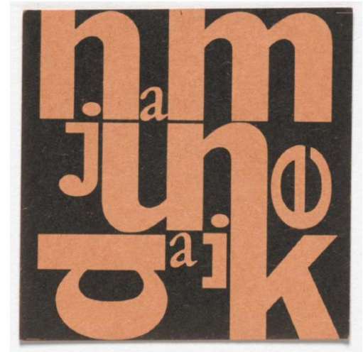
naamkaart Nam Jung Paik