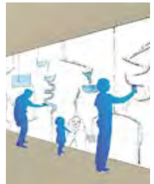
Spelen met een Interactive Wall