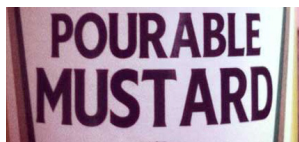
Wat is er mis met deze kerning?