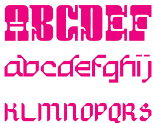
Originaliteit is belangrijk...

Voor deze eerste opdracht ga je een lettertype ontwerpen met behulp van een grid. Je kan beginnen met een simpel blokgrid en zogenaamde pixel-letters ontwerpen of je kiest een uitdagender grid.