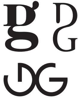
DG niet GD